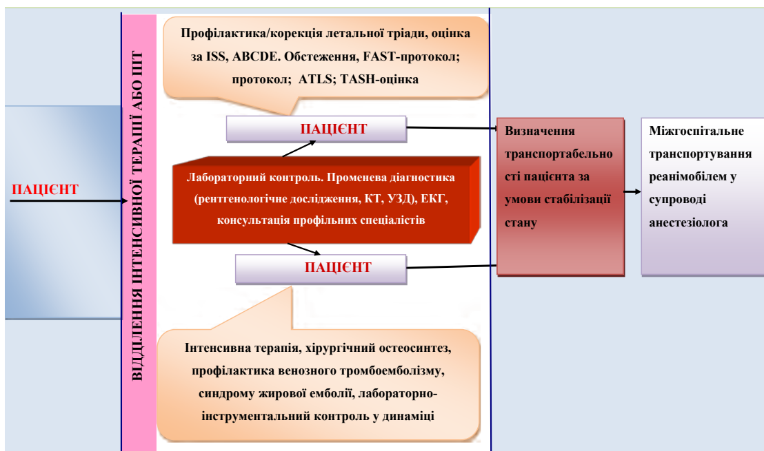
Схема 2. Запропонований протокол медичної допомоги під час міжгоспітального транспортування пацієнта зі скелетною політравмою

травмою, яким медична допомога надавалася згідно із загальноприйнятими рекомендаціями; основна група (n=120) – пацієнти зі скелетною політравмою, яким надання медичної допомоги проводилося згідно із запропонованим клінічним маршрутом пацієнтів, котрий можна застосовувати на другому і третьому рівнях надання медичної допомоги, і запропонованим протоколом медичної допомоги під час міжгоспітального транспортування пацієнта зі скелетною політравмою (схеми 1, 2).