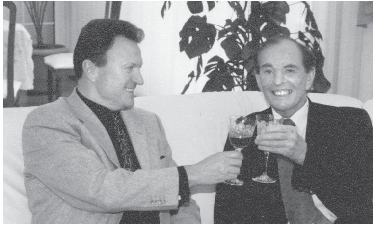
С легендой XX века и почетным доктором Одесского медицинского университета Кристианом Барнардом (ЮАР). 2001 г.