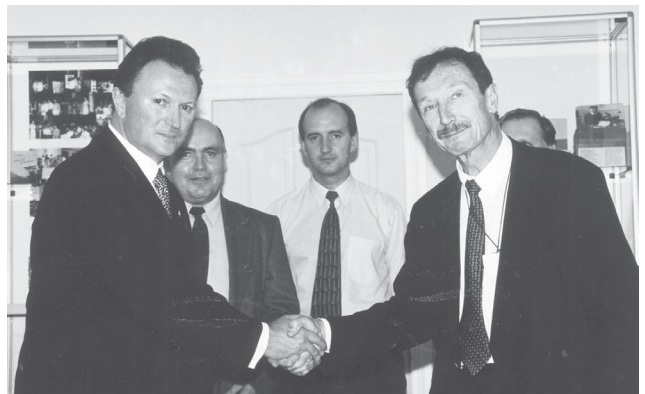
С лауреатом Нобелевской премии Рольфом Цинкернагелем (Швейцария). 2001 г.