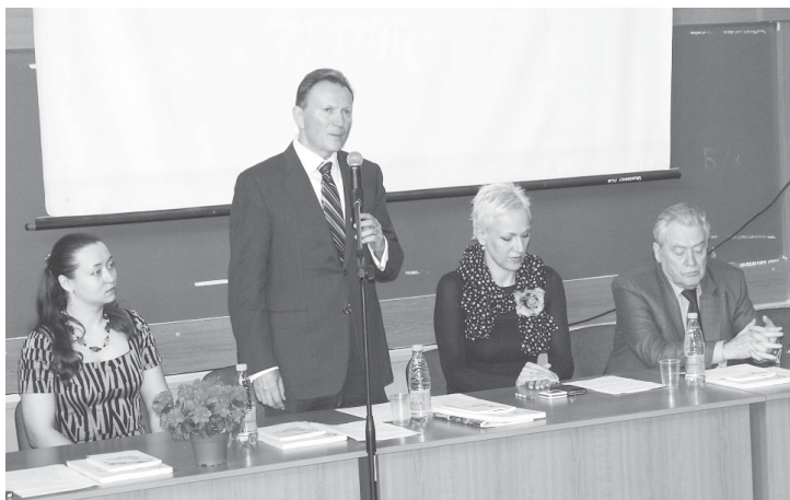
В жюри международной конференции студентов и молодых ученых