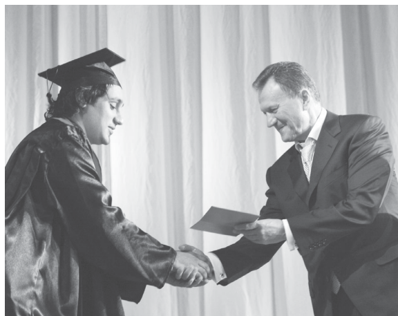
Получить диплом из рук ректора — высокая честь для студента

го направления — дифференцированного применения в медицинской практике органосберегающих технологий, эндоскопических, криохирургических и лазерных методов.