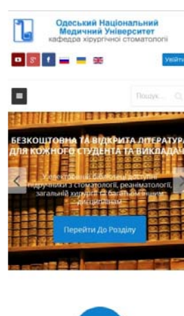
Рис. 3. Мобильная версия