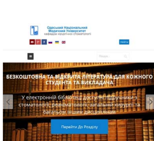
Рис. 2 Вид планшетной версии