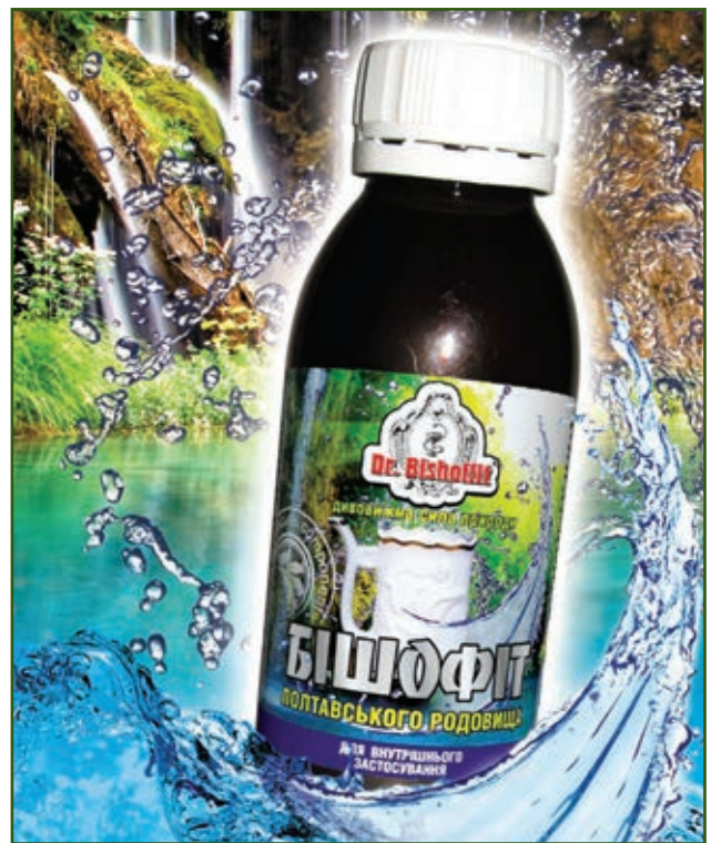
Рисунок 2 — Водный раствор «Полтавского бишофита»

Анализ биохимических показателей продемонстрировал нормализацию пигментного обмена ( p < 0,05 ) и уровня ферментов ЩФ и ГГТП у больных основной группы. Наряду с этим происходило значительное улучшение липидного спектра крови как биохимического маркера НАЖБП. Так, наблюдалось достоверное снижение уровня общего холестерина в среднем до ( 5,80 \pm 0,30 ) ммоль/л ( p < 0,02 ), \beta -липопротеидов — в среднем до ( 54,32 \pm 2,29 ) ед. ( p < 0,001 ), триглицеридов — ( 1,68 \pm 0,12 ) ммоль/л